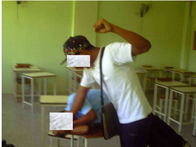
Alumnas de 1er año sección "B", peleando