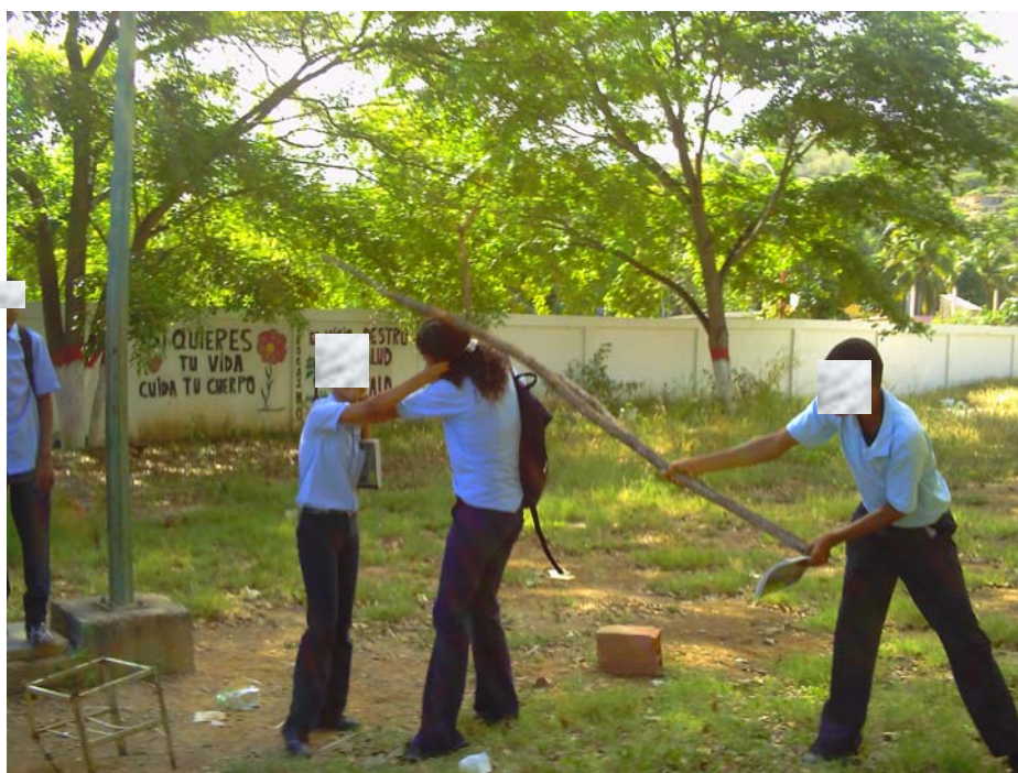
Alumnos de 1er año, sección “F”, en una fuerte agresión