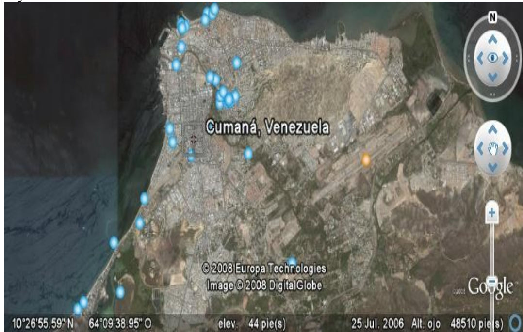
Figura 4. Fotografía satelital de la ciudad de Cumaná, área donde se ejecutará el proyecto.