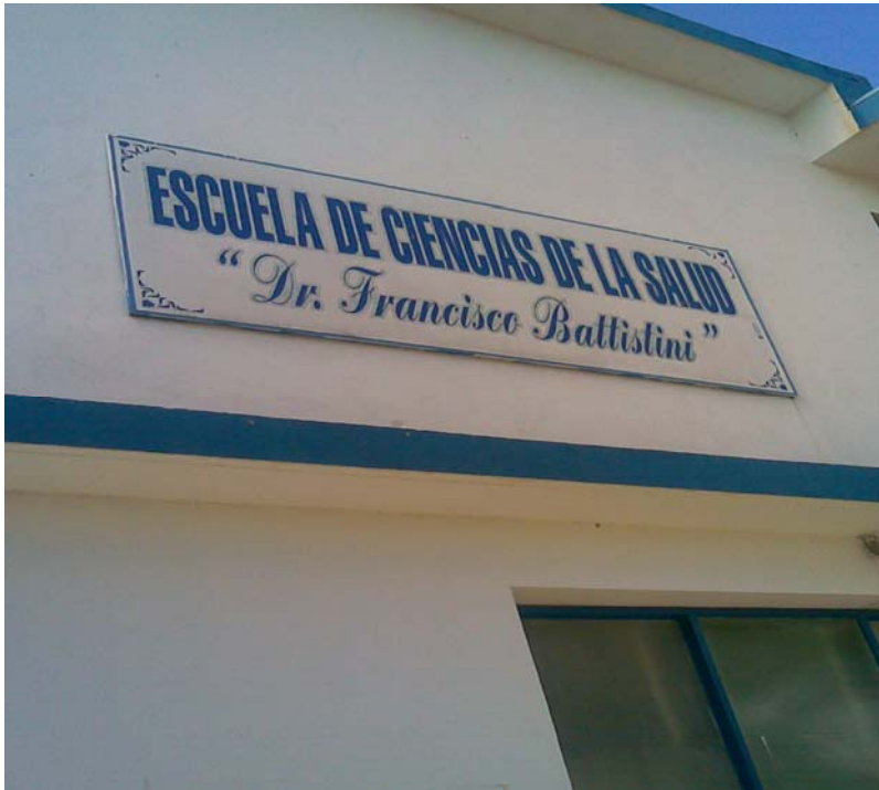
Universidad de Oriente Núcleo Bolívar, escuela de Ciencias de la Salud.