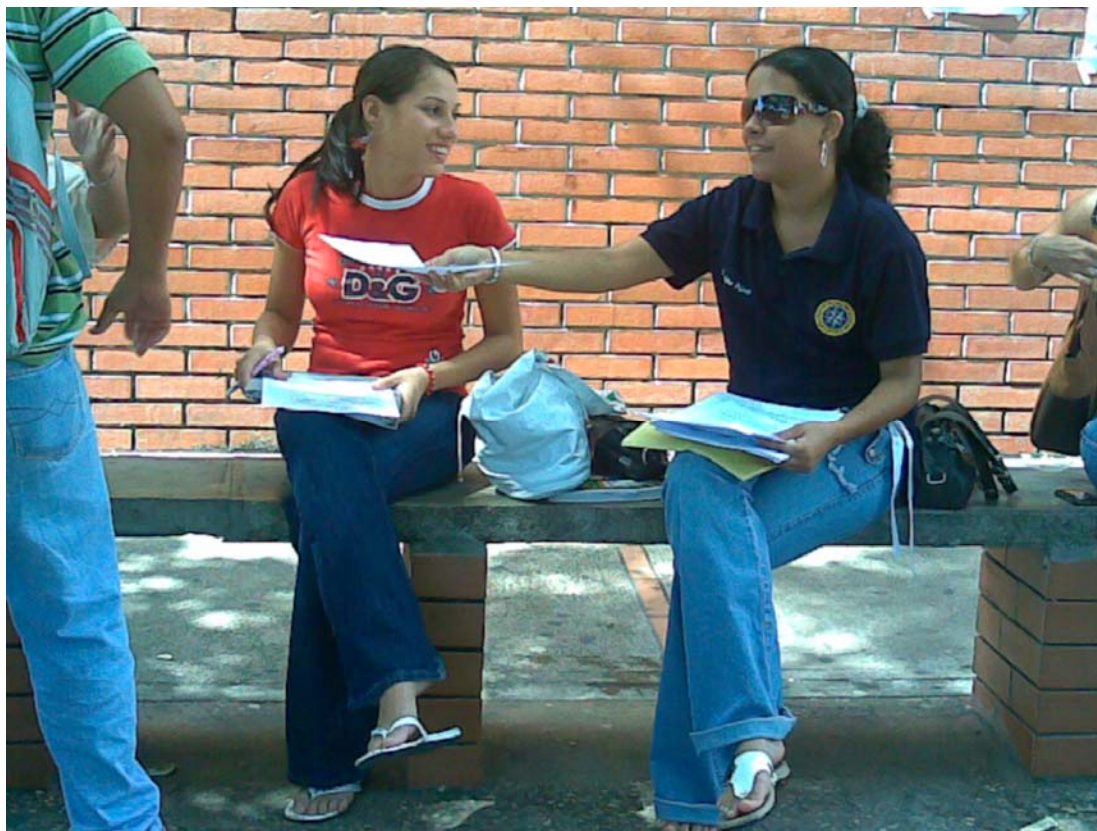
Universidad de Oriente Núcleo Bolívar.