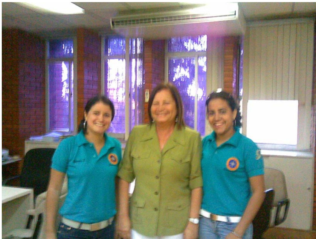
Universidad de Oriente Núcleo Anzoátegui.