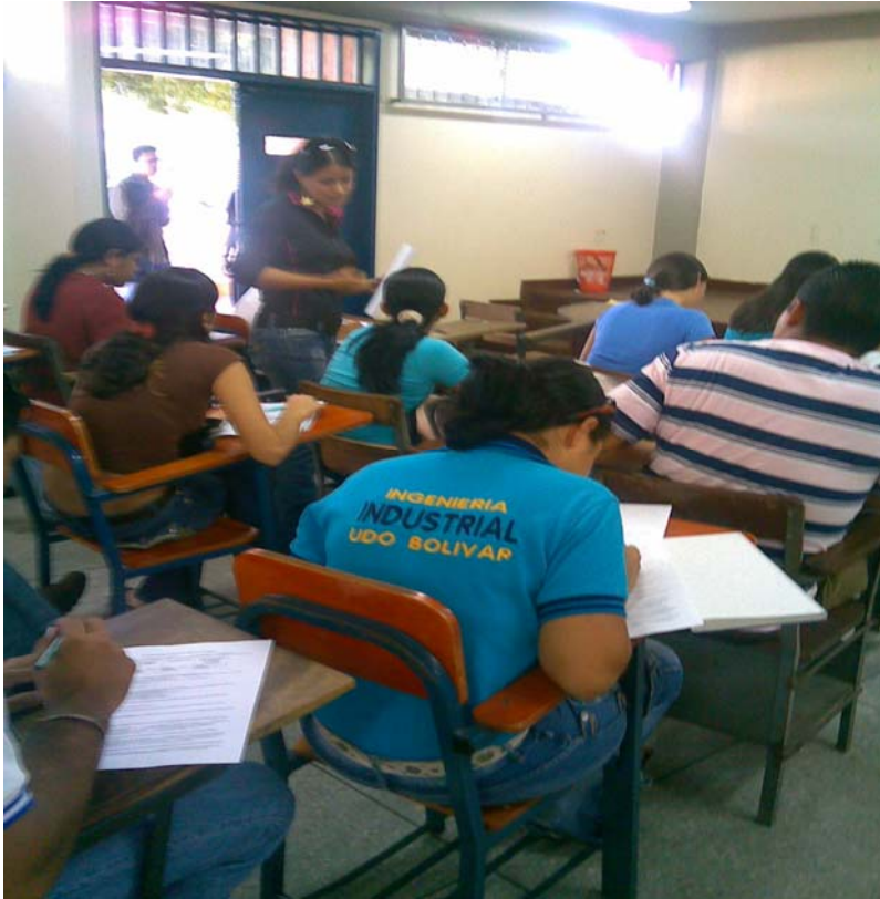
Universidad de Oriente Núcleo Bolívar.