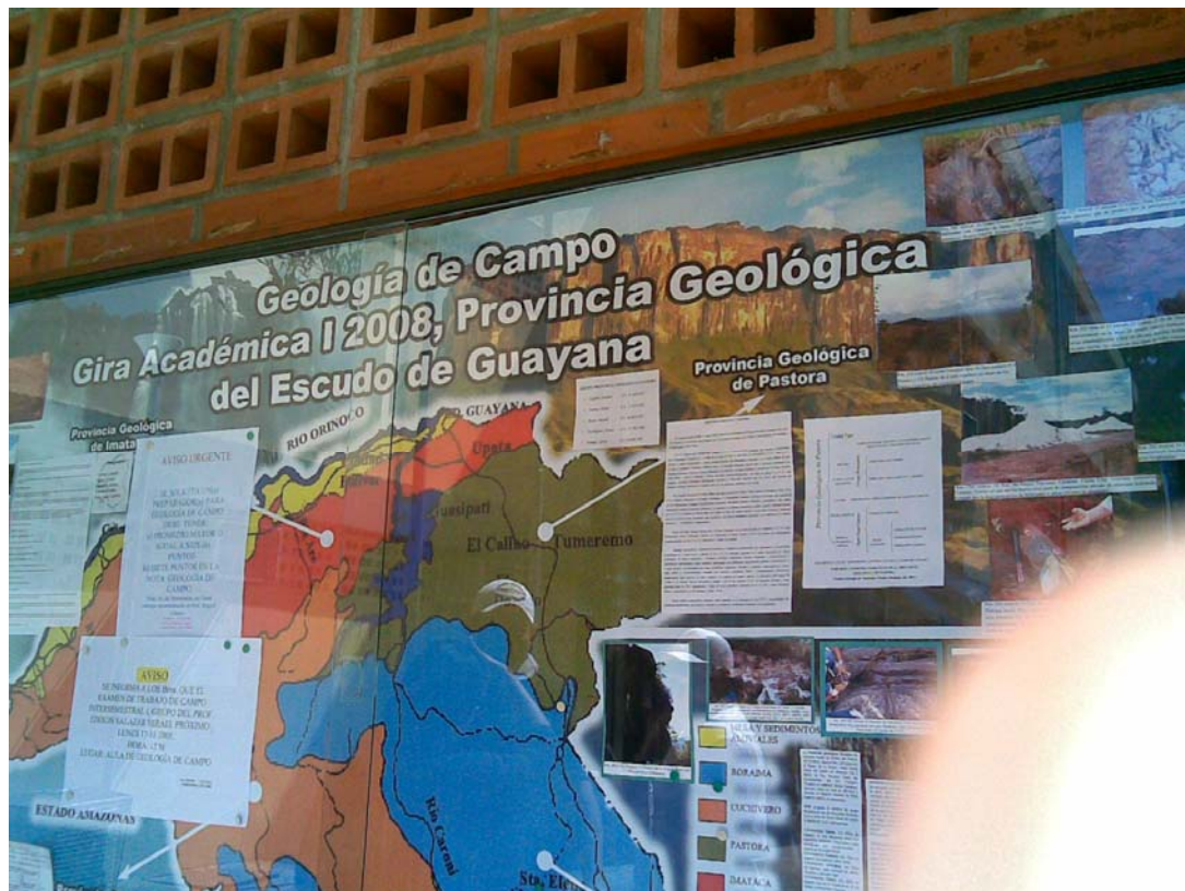
Universidad de Oriente Núcleo Bolívar, Departamento de Geología.