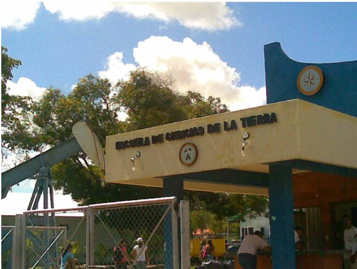
Univesidad de Oriente Núcleo Bolivar, escuela de Ciencias de la Tierra.

10. ¿Qué compromisos debe asumir la plana estudiantil para contribuir al mejor desempeño de la Gerencia Universitaria.(puede seleccionar varios) a.-Revisando el compromiso de sus lideres con la excelencia académica:_____ b.-Organizando debates para articular propuestas con la gerencia universitaria. c.- Reafirmando los valores y la identidad del Estudiante Universitario:_____d.- Hacer protestas (de calle):_____.