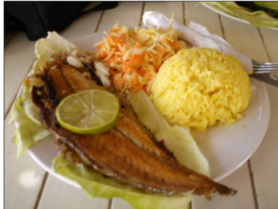
Figura 6. Comida Típica, Carite Frito. 2007.

Estos testimonios evidencian que los lugareños de Playa La Punta utilizan parte de sus costumbres y forma de vida tradicional como oferta turística, que a fin de cuentas se traduce en bienestar para ellos, ya que de alguna u otra forma adquieren beneficios económicos, un aporte a la diversificación de la oferta turística en el destino y la gratitud personal de que los visitantes de este destino queden satisfechos y con ganas de volver al mismo.