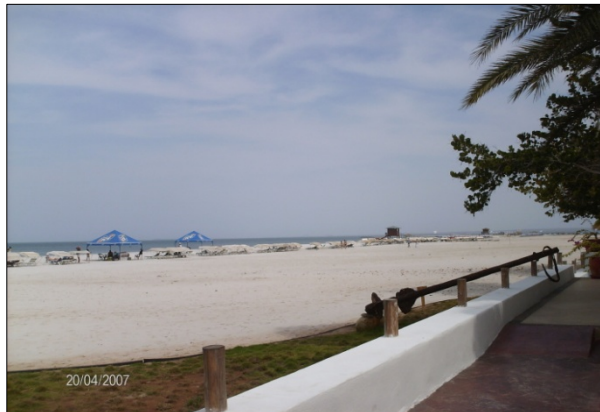
Figura 11. La Punta. 2007.

De igual forma, el Sujeto 3 hace referencia a la necesidad del apoyo de diversos organismos en materia de capacitación: