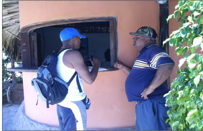
Figura 13. Sujeto expresando sus ideas. 2007.

Según este sujeto, la base de la integración turística radica fundamentalmente, en la formación de los jóvenes como generación de relevo, que a fin de cuentas son los que con sus estudios, trabajos y esfuerzos, tienen la posibilidad de que la actividad (figura14) siga progresando en los años venideros. Al respecto el mismo Sujeto 6 expresa: