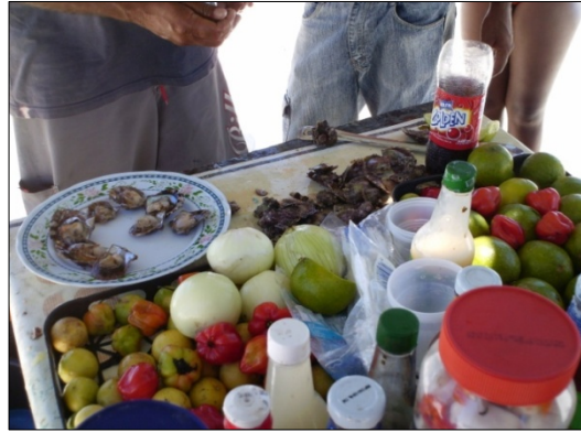
Figura 9. Preparación de Ostras. 2007.

Estas actividades han venido surgiendo de la creatividad e imaginación de los habitantes de Playa La Punta, además de lo que tienen como referencia de otros destinos turísticos, como la Isla de Margarita. Muchas de estas actividades se han internacionalizado a nivel mundial como por ejemplo el alquiler de sillas y toldos, o las motos de agua. Al respecto el Sujeto 3 señala: