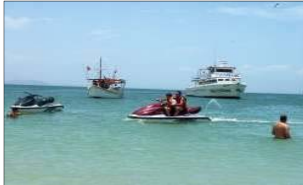
Figura 14. Motos de Agua. 2007.

Visto desde esta perspectiva, es de suma importancia que la integración turística entre todos los sectores (Estado, comunidad y empresa privada) en este destino se haga sentir de forma armoniosa, ya que en primer lugar, los problemas como la ausencia de baños y duchas de uso público, ausencia de módulos de información turística y la problemática referente el agua potable, se pueden ir minimizando, y en segundo lugar, este destino podría ir trabajando en pro de ser un atractivo turístico consolidado, a fin de que exista calidad en los servicios y productos que se ofertan, hospitalidad y respeto en la atención, mejor calidad de vida de los residentes, entre otros.