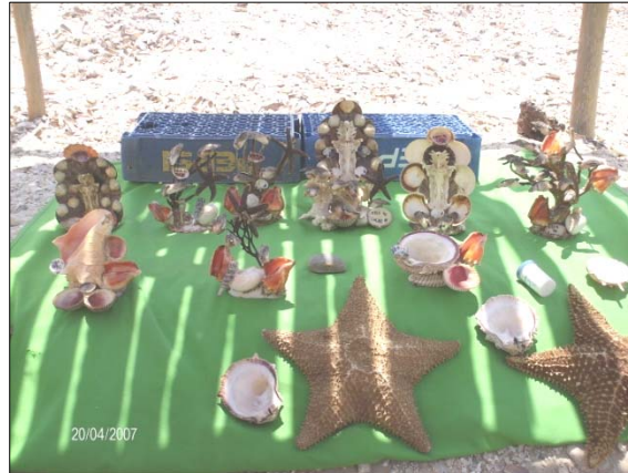
Figura 3. Artesanía. 2007.

La artesanía en Playa La Punta simboliza una alternativa de empleo, como el caso del Sujeto 6 (figura 4), que realiza varias actividades en Playa la Punta y la artesanía es una de ellas: