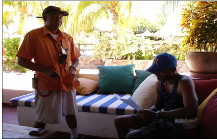
Figura 12. Sujeto informante. 2007.

Evidentemente, se refleja un ambiente de motivación turística por parte de los residentes, tanto así que llegan a considerar a los turistas como parte de su familia. Así también lo afirma el Sujeto 6: