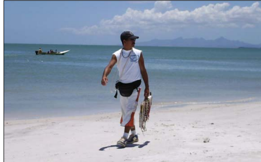
Figura 7. Vendedor de la playa. 2007.

Es clara la posición de estas personas al brindar seguridad y bienestar a los visitantes en su permanencia en el destino. Éste es un ejemplo de la organización de los miembros de ésta comunidad, los cuales juegan un papel fundamental en el sostenimiento de la misma, ya que cuanto más organizada sea, o más eficazmente organizada esté la comunidad más capacidad tendrá. (Bartle, 2007). Asimismo, el Sujeto 6 señaló: