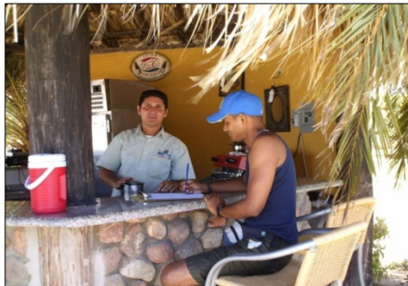
Figura 10. Sujeto expresando su Opinión. 2007.

Es de notar que los pobladores están conscientes de que las actividades turísticas que ellos practican son beneficiosas, sin embargo, existen problemas como los mencionados por el Sujeto 3, los cuales son pertinentes resolver en el menor tiempo posible, ya que estas fallas en los servicios públicos pueden afectar la actividad turística.