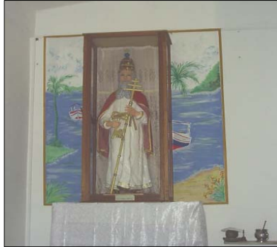
Figura 1. Imagen de San Pedro de coche. 2007.

Ahora bien, la práctica de esta religión y las tradiciones folklóricas (figura 2) también se ve reflejada en otras celebraciones como el velorio de la Cruz de Mayo y las fiestas de la Virgen del Valle, afirmación del Sujeto 3: