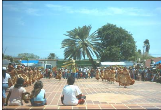
Figura 2. Diversiones Folklóricas en la Plaza San Pedro de coche. 2007.