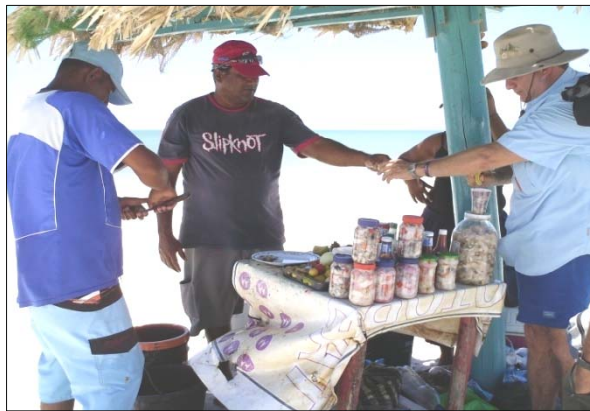
Figura 5. Vendedor de Comidas Típicas en su Faena Laboral. 2007.

Cabe considerar, como elemento adicional a la oferta gastronómica de Playa La Punta, la atención ofrecida por estos vendedores a los visitantes de la playa, donde con su particular 'picardía', tratan de hacer que el cliente se sienta satisfecho, dándoles a probar de los alimentos y hasta relatando espontáneamente anécdotas, con el fin de hacerle pasar un rato agradable al turista.