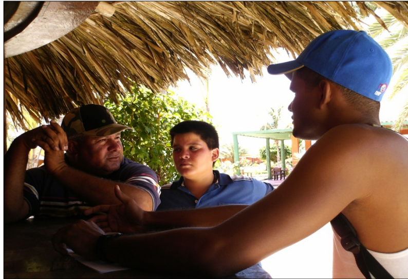
Figura 8. Sujeto suministrando información. 2007.

Dentro de este orden de ideas, se puede decir que la enseñanza parte, en un principio, desde el núcleo familiar, e incluso es una forma de unir a la familia, afirma el Sujeto 6: