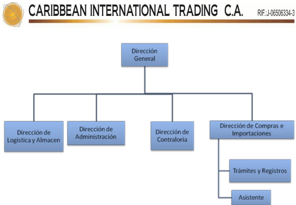
Figura 1. Estructura organizativa de Caribbean International Trading, C.A. proporcionada por el administrador de la empresa (2016).