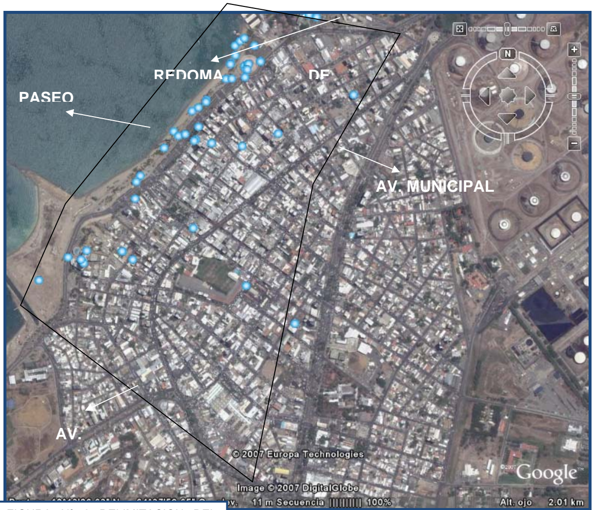
FIGURA Nº 2 DELIMITACION DEL