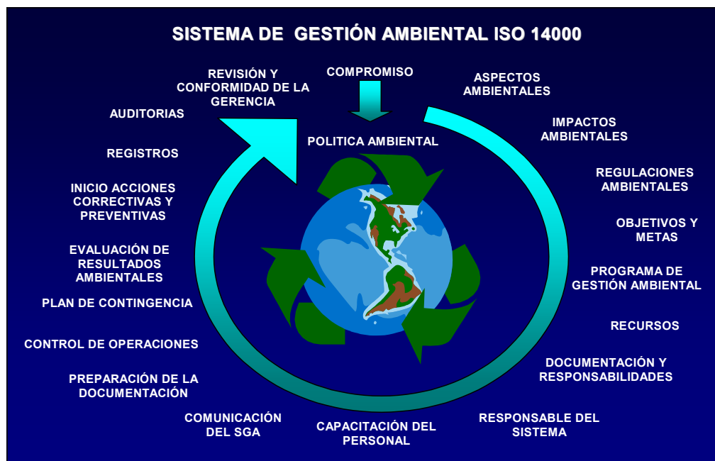
Figura 4.1. Modelo de sistema de gestión ambiental ISO 14000.[8]